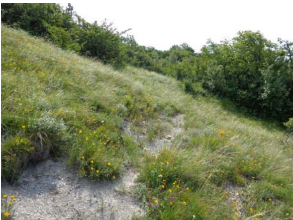
Wald- und Gebüchsäume sowie offene Halbtrockenrasen bilden die Lebensräume des Waldsteppen-Beifußes.

Die Ausbreitung erfolgt vorwiegend vegetativ über lange Rhizome, Blühtriebe werden relativ spät und in geringem Ausmaß gebildet (August bis Oktober, max. 5% der Rameten) und können auch mehrere Jahre lang fehlen. Beobachtungen aus Tschechien legen nahe, dass die Blühbereitschaft nach stressreichen Vegetationsperioden (z.B. nach Bränden) höher ist. Fruchtbildung und Keimung findet nur spärlich statt.