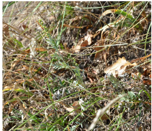
Blühtrieb von Waldsteppen-Beifuß ( Artemisia pancicii ).

Der Waldsteppen-Beifuß gehört zur Pflanzenfamilie der Korbblütler ( Asteraceae ). Die Art wächst mit langen Rhizomen, ihre Laubblätter sind zweifach gefiedert und seidig-weißfilzig behaart. Sie ähneln denen des Echten Wermuts ( Artemisia absinthium ) mit dichter graufilziger Behaarung, sind allerdings im Gegensatz zu letzteren geruchlos. Verwechslungsmöglichkeit besteht mit A. laciniata , die aber schmalere und mehr oder weniger kahle Laubblattzipfel aufweist. Blühend erreicht Artemisia pancicii eine Höhe von 25-75 Zentimeter. Seine Blütenkörbe besitzen einen Durchmesser von 3-4 Millimeter und sind – da windbestäubt – unauffällig.