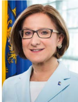
Johanna Mikl-Leitner Landeshauptfrau von Niederösterreich