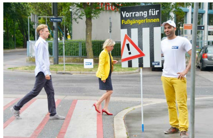
„Vorrang für Zebras“ – eine Aktion für partnerschaftliches Denken und Handeln im Straßenverkehr.

Fahrbahn nicht überraschend zu betreten, um einem unsicheren Verhalten vorzubeugen. Die beste Wirkung wird erzielt, wenn die Sicherung täglich stattfindet. Ersatzpersonen müssen daher vorab festgelegt werden. Es muss die gesamte Organisation der Schulwegsicherung von den Eltern bzw. interessierten Personen durchgeführt werden. Insbesondere soll dabei festgelegt werden, welche Personen wie oft eingesetzt werden und wer als Vertretung zur Verfügung steht (Einsatzplan).