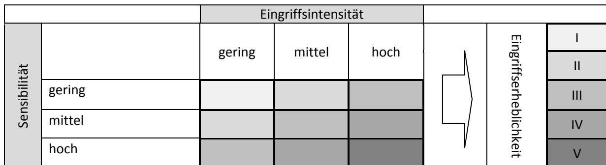
Abbildung 9: Ermittlung der Eingriffserheblichkeit

Die Eingriffserheblichkeit ergibt sich aus der Verknüpfung der Sensibilität des Untersuchungsgebiets mit der Eingriffsintensität des Vorhabens. Dabei kommt nachstehende Tabelle (Abb. 10) zur Anwendung: