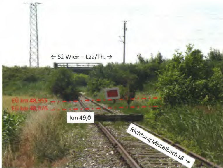
Blickrichtung Ernstbrunn im Hintergrund Unterquerung der ÖBB-Bahnlinie S2 hinter der S2-Brücke befindet sich rechts die provisorische Haltestelle „Mistelbach Interspar“ in ca. km 48,82 (Bahnsteigschüttung sichtbar); im Vordergrund provisorischer Gleisabschluss in km 49,0 (Eigentumsgrenze ÖBB/NOVOG)