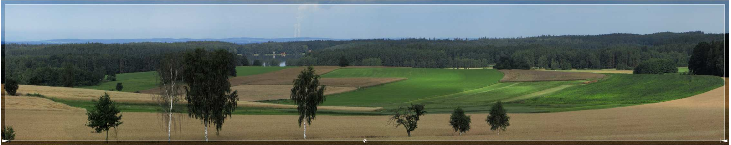
Bild 5.14: Ein charakteristisches Erscheinungsbild des KKW Temelin in den betroffenen Landschaftsräumen des Außenrings – eine kaum zu erkennende Silhouette, die nur durch die Dampfschleppen der Kühltürme hervorgehoben über den Grenzhorizont hinausragt: Blick von Roseč über den Teich Holná (betroffener Landschaftsraum LSG Třeboň, Blick von O aus einer Entfernung von 39 km; das Panorama zeigt zugleich auch das relativ am meisten betroffene Gebiet des LSG Třeboň)