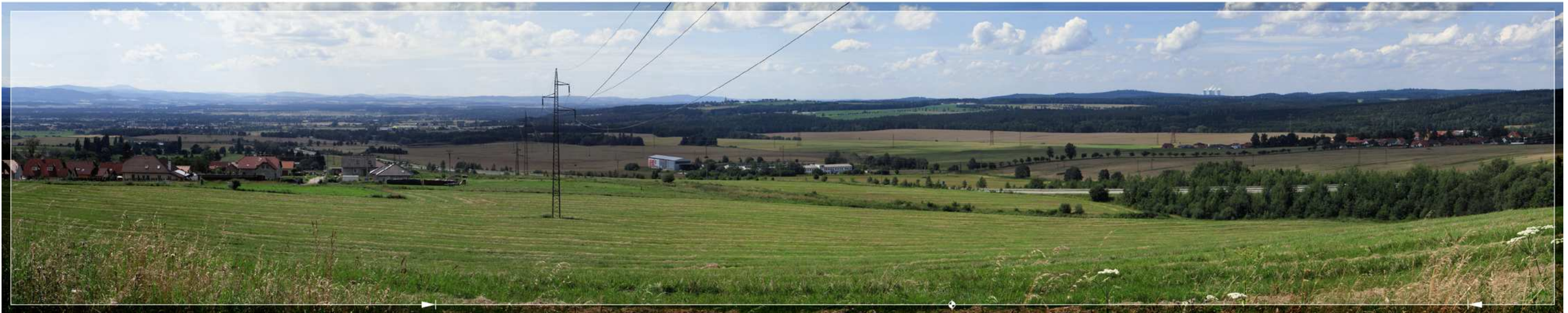
Bild 5.05: Silhouette des KKW Temelin am markanten Blickhorizont des Hügellands von Tábor. Blick vom östlichen Randhang des Beckens von České Budějovice – betroffener Landschaftsraum Ballungsraum von České Budějovice (der nördliche Bebauungsrand der Stadt ist im linken Teil des Panoramas zu erkennen); Blick von SO aus einer Entfernung von 23 km