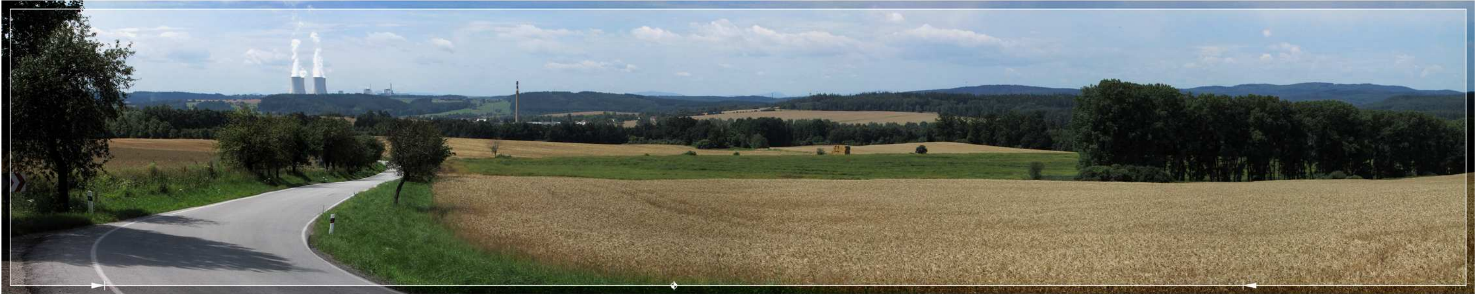
Bild 5.04: Typisches Erscheinungsbild des KKW Temelin in den betroffenen Landschaftsräumen des Innenrings – markante Silhouette am Himmel des Grenzhorizonts (betroffener Landschaftsraum Týn nad Vltavou, Panorama von der Straße II/122 zwischen Netěchovice und Týn n. Vlt.; Blick von NO aus einer Entfernung von 8,8 km)