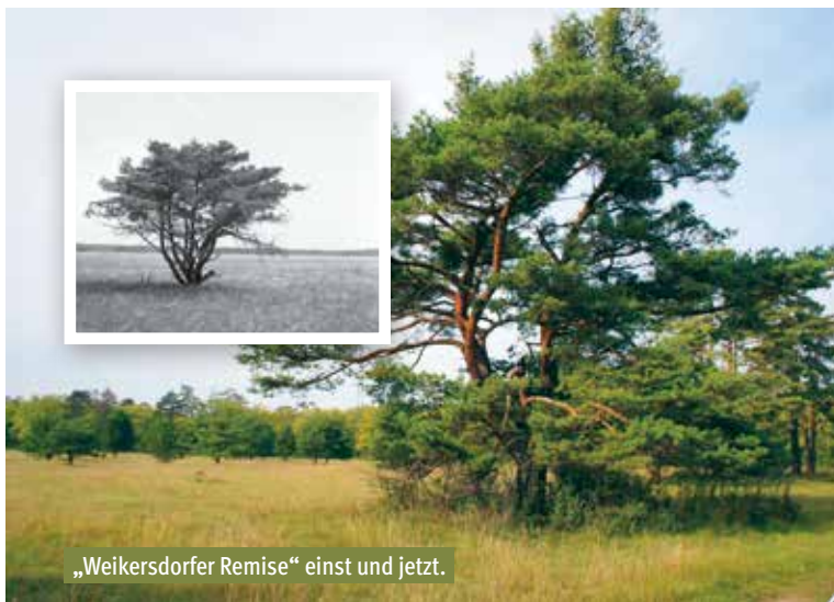
„Weikersdorfer Remise“ einst und jetzt.