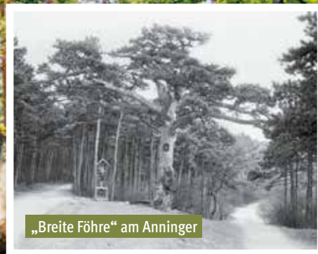
„Breite Föhre“ am Anninger