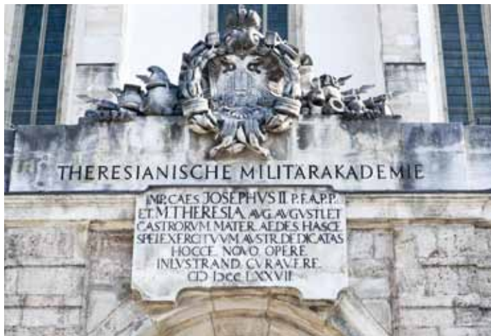
Ehemalige Residenz Kaiser Friedrich III., heute Militärakademie

Wiener Neustadt verdankt seine Entstehung den Babenberger Herzögen Leopold V. (1177–1194) und Leopold VI. (1198–1230). Im Jahre 1192 war aufgrund eines Erbvertrags das Herzogtum Steiermark an Leopold V. gefallen. Dieser beschloss, im gering besiedelten Steinfeld – damals einem Teil der Steiermark – zum Schutz