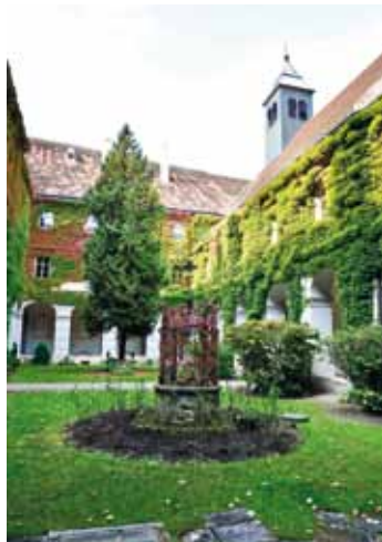
Stift Neukloster, Kreuzgang

www.neukloster.at stadtmuseum.wiener-neustadt.at /stpeterandersperr