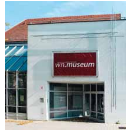
Stadtmuseum Wiener Neustadt

Die 1444 aus dem Stift Neukloster abgesiedelten Dominikaner zogen in das ca. 1250 gegründete Kloster der Dominikanerinnen St. Peter in der Sperr ein. Peter von Pusika erneuerte 1450–1475 Kirche und Kloster. Im 16. Jh. wurden die Gebäude von Klarissinnen aus Tyrnau genutzt, dann durch die Diözese Wiener Neustadt und nach Erdbebenschäden 1768 nur mehr profan. Das heute darin eingetretene Stadtmuseum präsentiert u. a. den sogenannten Corvinusbecher , einen zwischen 1470 und 1490 entstandenen Prunkpokal aus vergoldetem Silber. Die Ritterfigur auf dessen Deckel trägt sowohl die Devise „A.E.I.O.U.“ Kaiser Friedrichs III. als auch das Raben-Monogramm des ungarischen Königs Matthias Corvinus . Zur Entstehung des Pokals gibt es unterschiedliche Überlieferungen. Eine Version besagt, dass Corvinus ihn anlässlich des Friedens von Ödenburg 1463 für die zurück erhaltene ungarische Stephanskronen an Friedrich übergeben haben soll. Nach anderen Traditionen soll er ein Geschenk Friedrichs für Corvinus gewesen sein, das schließlich aus politischen Gründen nicht überreicht wurde.