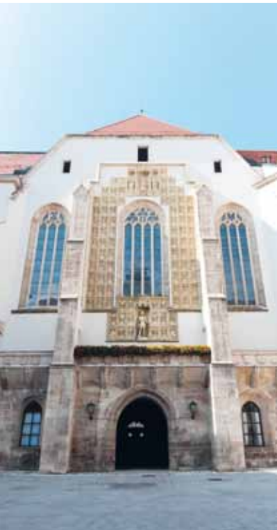
St. Georgs-Kathedrale, Wiener Neustadt