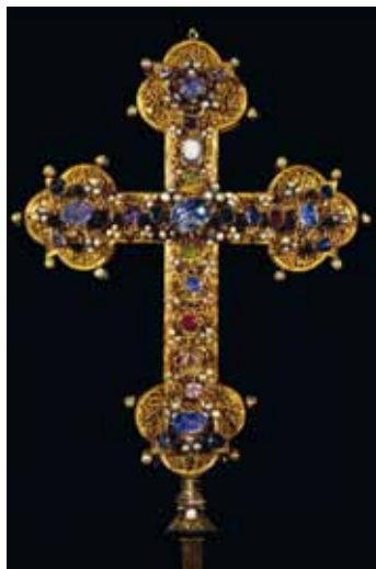
Rückseite des Melker Kreuzes

Landesheiligtümer, Melk war jedoch älter. Seit dem Jahr 1114 barg es das Grab des hl. Koloman und bildete damit die Verehrungsstätte des Landespatrons. Ebenso war es Aufbewahrungsort des wertvollsten Reliquiars im Land, nämlich des Melker Kreuzes . Laut Eintragung in die Melker Annalen (ca. 1123) hat der Babenberger Markgraf Adalbert 1040 von einer Pilgerreise ins Heilige Land eine Kreuzespartikel in seine Melker Burg heimgebracht und diese an die hier ihren geistlichen Dienst versehenen Kanoniker übertragen. Der Kreuzesspan erhielt eine entsprechende Fassung und wurde auch von den im Jahre 1089 in die Babenbergerburg einziehenden Benediktinermönchen hoch in Ehren gehalten.