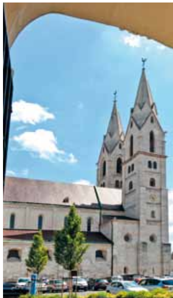
Wiener Neustädter Dom