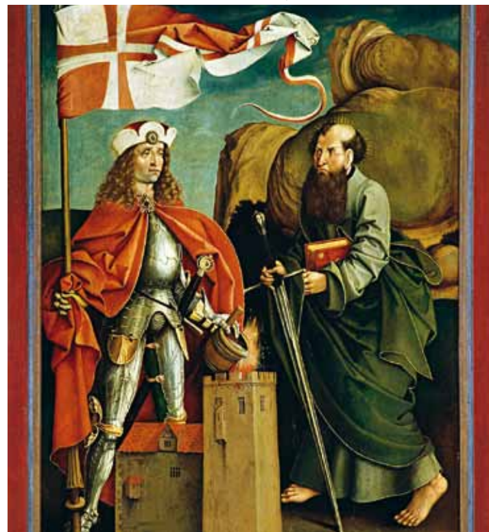
Wullersdorfer Altar, links: Kaiser Maximilian I. als hl. Florian

schaftlich und disziplinär besonders zum Schlechten stand, wurde auserkoren, als eine Art Modellkloster zu fungieren, und ist zu diesem Zweck mit Unterstützung des Herzogs völlig reformiert worden. Benediktinermönche aus zahlreichen anderen Klöstern lernten fortan in Melk das strenge Reformleben kennen, auch wurden Mitglieder des Melker Konvents als Äbte dorthin berufen. Aus der Spätzeit der Melker Reform stammt der Wullersdorfer Flügelaltar von Jörg Breu (1502) mit seinen 16 Tafelbildern. Auf einem von ihnen ist Kaiser Maximilian I. mit den Attributen des hl. Florian portraitiert.