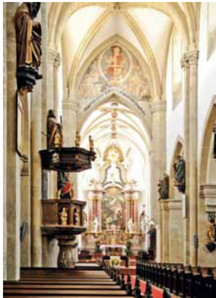
Wiener Neustädter Dom, Innenansicht

1444 stiftete König Friedrich einen weltlichen Chorherrenkonvent mit Sitz auf der Burg , der die Gottleichnamskapelle betreute. 1459 jedoch versetzte er die Chorherren an die Pfarrkirche Maria Himmelfahrt , die damit zur Kollegiatskirche erhoben wurde. Deren spätromanisch-frühgotischer Bau mit seinem reichverzierten Südportal von 1238 war 1279 geweiht worden. Im frühen 14. Jh. wurden Chor und Querschiff fertiggestellt. Die romanischen Türme sind Nachbildungen des 19. Jhs.