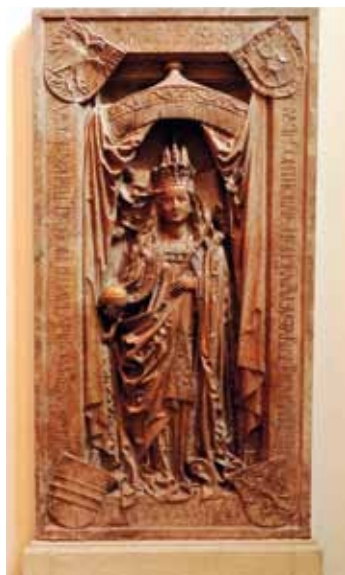
Epitaph der Kaiserin Eleonore

Diese hatte er aus dem Stift Rhein berufen, wo sein Vater Ernst der Eiserne begraben liegt. Um 1452 wurde die alte 1250 geweihte Dominikanerkirche durch die Einebnung des erhöhten Mittelschiffes zu einer Hallenkirche umgebaut. Im Westen entstanden 1453 zwei neue Kapellen, die Peter von Pusika zugeschrieben werden. Auch stiftete Friedrich der Kirche einen spätgotischen Flügelaltar mit Schnitzfiguren, der seit 1885 im Stephansdom in Wien steht. Als 1698 der raumhohe barocke Altaraufbau einige Meter vor dem alten Hochaltar aufgestellt wurde, ergab sich aus dem Chorschluss ein abgeschlossener Raum, der vom Kreuzgang aus zugänglich ist. Hier befindet sich bis heute das Grab der Kaiserin Eleonore , der Frau von Kaiser Friedrich III., die 1467 in Wiener Neustadt verstarb. Sie wurde ihrem Wunsch entsprechend bei ihren verstorbenen Kindern Christoph, Helene und Johannes beigesetzt. Deren