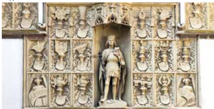
Wappenwand mit Kaiser Friedrich III.