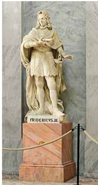
Habsburgerstatue im Habsburgersaal

Der etwa 20 km südlich von Wien gelegene Markt Laxenburg hieß bis in das 15. Jh. Lachsendorf und wurde so erstmals 1133 genannt. Die Herrschaft fiel Anfang des 14. Jhs. an die Habsburger. Diese nutzen die Burg und die umliegenden Schwachat-Auen vor allem für die Jagd. Unter Herzog Albrecht II. (1298–1358) wurde eine Burgkapelle gebaut, sein Sohn Herzog Albrecht III. (1365–1395) ließ 1386 bis 1394/95 die Burg zu einem Jagdschloss ausbauen. Dabei verwendete man Spolien auch aus der ehemaligen Burg auf dem heutigen Leopoldsberg bei Wien. Die polygonale Chorapsis der Kapelle , die heute einen Teil der östlichen Schlossfassade bildet,