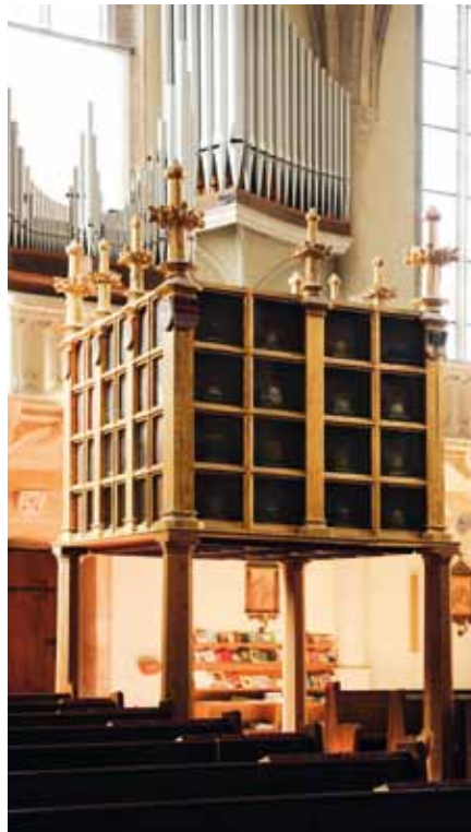
St. Georgs-Kathedrale, Reliquienschrein

Unter Herzog Friedrich II. dem Streitbaren (1230–1246) wurde gegen Mitte des 13. Jhs. mit dem Bau der landesfürstlichen Burg in der Südostecke der Stadt begonnen. Als im habsburgischen Teilungsvertrag von 1379 Wiener Neustadt wieder an die Steiermark fiel, wurde es zur Residenz der steirischen Linie. Nach starken Beschädigungen durch Erdbeben begann man unter Herzog Leopold III. (1370–1386) 1378 mit einem größeren Neubau der Burg. Die mächtige Anlage hatte Gräben und vier Ecktürme, von