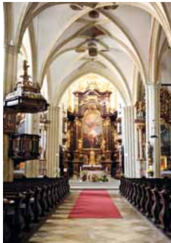
Stift Neukloster, Mittelschiff und Hochaltar

Im Jahre 1444 übergab Friedrich III. das 1227 als Dominikanerkloster gegründete Stift Neukloster , das neben der Burg liegt, den Zisterziensern.