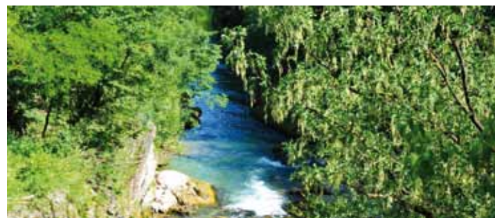
An der Erlauf

Städte, Gemeinden und Ortschaften bergen wohl gehütete, aber teilweise kaum bekannte Schätze, die auf unserem Rundgang geschildert werden: Wieselburg, Purgstall, Scheibbs, St. Anton an der Jeßnitz, Puchenstuben und Frankenfels, Gaming und Lackenhof, Lunz, Neuhaus und Zellerrain, Lilienfeld, Türnitz, Annaberg, Josefsberg und Joachimsberg sowie Mitterbach an der Landesgrenze zur Steiermark. Die einzelnen Abschnitten zugeordneten Exkurse schildern wesentliche Faktoren, die die Entwicklung der gesamten Region maßgeblich beeinflusst haben und zum Verständnis des Gebietes notwendig sind.