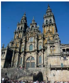
Kathedrale in Santiago de Compostela

Herbert Hirschler , geb. 8.11.1965 in Sieding/Ternitz, NÖ, ist als Musik- und Textautor für bisher ca. 600 Titel im Bereich der volkstümlichen Musik und des deutschsprachigen Schlagers verantwortlich und