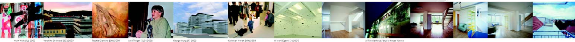
Hunt Work (UK) 2000