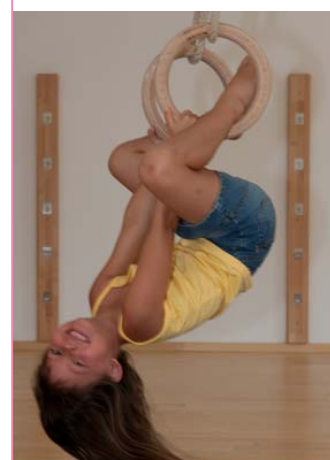
6 Hüther (2006)