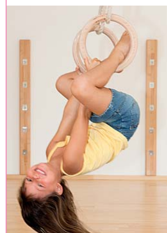
6 Hüther (2006)