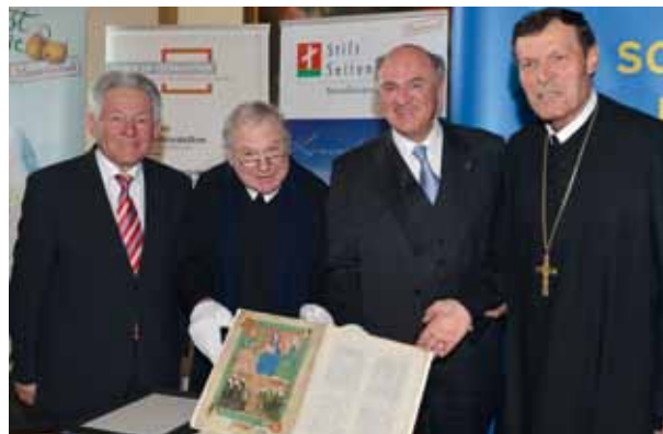
Landeshauptmann Dr. Erwin Pröll und Landeshauptmann Dr. Josef Pühringer informierten über die Ausstellung „Leben im Vierkanthof. Wo Bauern und Mönche beten und arbeiten“ die in Stift Seitenstetten und im Sumerauerhof in St. Florian stattfinden wird.