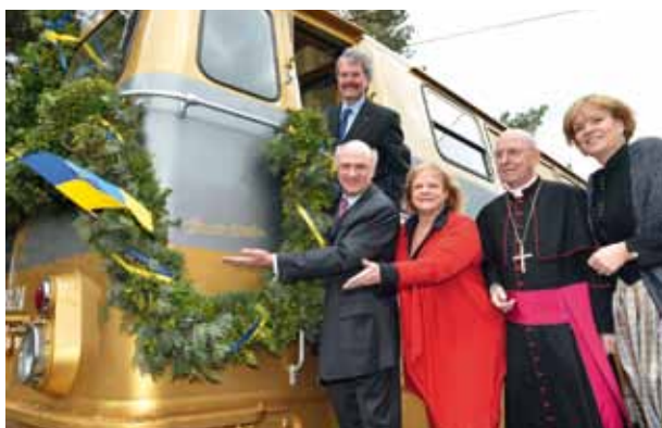
Zum Saisonauftakt der Wachaubahn nahm Landeshauptmann Dr. Erwin Pröll die Taufe der im neuen, goldenen Design gestalteten Diesellok auf den Namen „Dom der Wachau“ vor.

„Den schönsten Blick in das Weltkulturerbe Wachau hat man von der Trasse der Wachaubahn“, zeigte sich Landeshauptmann Dr. Erwin Pröll überzeugt. Anlässlich der Feierlichkeiten zum Saisonauftakt der Wachaubahn nahm er die