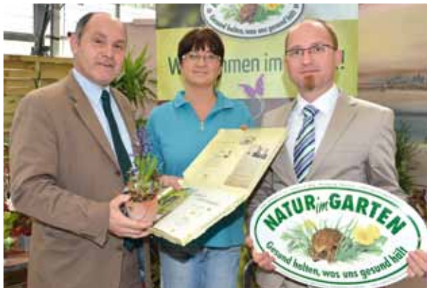
Landeshauptmann-Stellvertreter Mag. Wolfgang Sobotka stellte im Rahmen der Aktion „Natur im Garten“ ein umfassendes Gartenpaket mit vielen Informationen und Inhalten vor.

In der Gärtnerei Konrad in St. Pölten stellte Landeshauptmann-Stellvertreter Mag. Wolfgang Sobotka im Rahmen der Aktion „Natur im Garten“ ein umfassendes Gartenpaket mit vielen Informationen und Inhalten vor, das Neueinsteigern den ersten Schritt zum eigenen Naturgarten erleichtern soll.