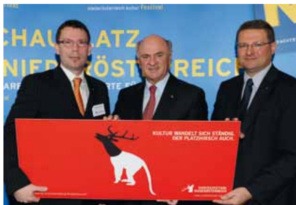
Landeshauptmann Dr. Erwin Pröll präsentierte das Programm des diesjährigen Viertelfestivals, das unter dem Motto „in Fluss. analysieren bewegen verändern“ vom 12. Mai bis 12. August im Mostviertel stattfindet.

„Das Viertelfestival holt in regelmäßigen Abständen regionale Chöre, Blasmusikkapellen und kleinere Museen vor den Vorhang und trägt damit dazu bei, dass die Aufbruchsstimmung in der Vereinswelt nicht abebbt“, so Pröll weiter, der auch den Bildungsauftrag des Viertelfestivals hervorhob. Insgesamt werden sich heuer 13 Schulprojekte intensiv und kritisch mit Vergangenheit, Gegenwart und Zukunft auseinandersetzen, wodurch der kulturelle Nachwuchs sowohl herangezogen als auch herausgefordert werden soll. Schließlich käme den Viertelfestivals auch eine entscheidende Funktion bei der Stärkung der Identifikation einer Region zu, meinte der Landeshauptmann abschließend: „Regionsspezifische Kulturarbeit in der Funktion eines kulturellen Nahversorgers ermöglicht einen