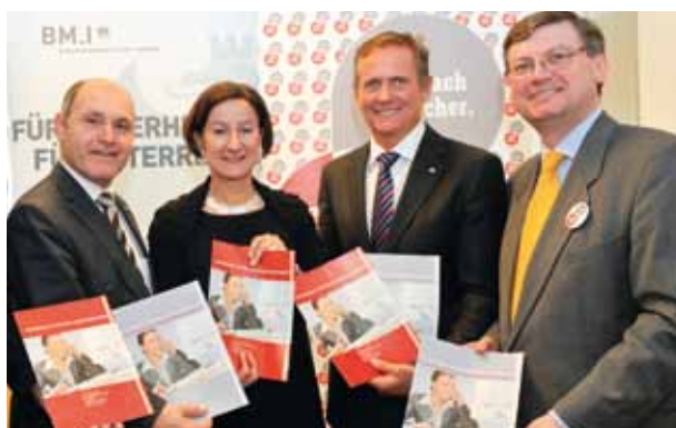
Innenministerin Mag. Johanna Mikl-Leitner und Landeshauptmann-Stellvertreter Mag. Wolfgang Sobotka präsentierten zwei Handbücher für Sicherheitsmaßnahmen in öffentlichen Gebäuden.

Rund ein Jahr nach dem tragischen Vorfall in der Bezirkshauptmannschaft Wien-Umgebung in Klosterneuburg wurden in den Räumen des Landeskrankenhauses Mostviertel in Melk zwei Handbücher für Sicherheitsmaßnahmen in öffentlichen Gebäuden präsentiert, die in einem Arbeits-