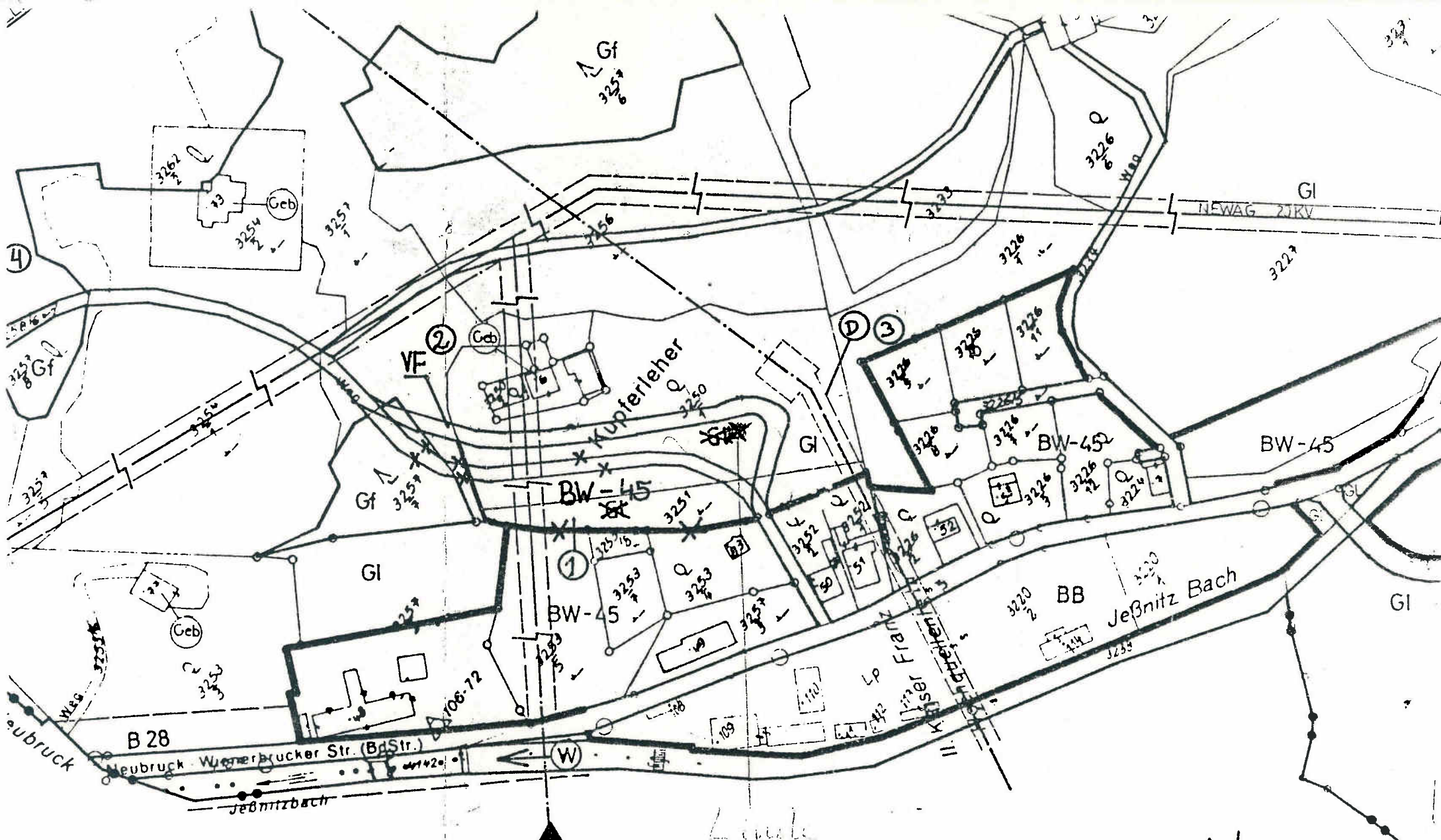
Ausschnitt aus dem Flächenwidmungsplan St. Anton a. d. Jeßnitz: Maßstab 1:2000