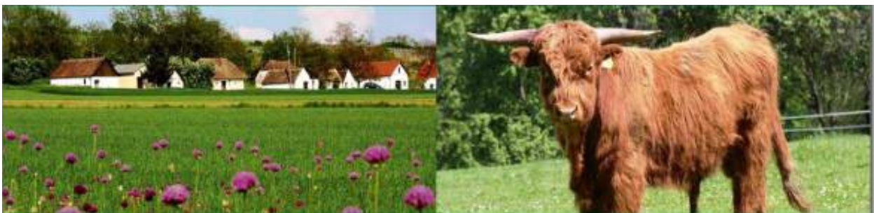
Grüner Bericht 2009