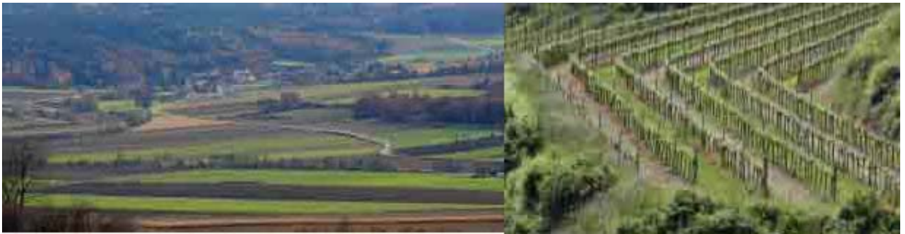
Grüner Bericht 2010