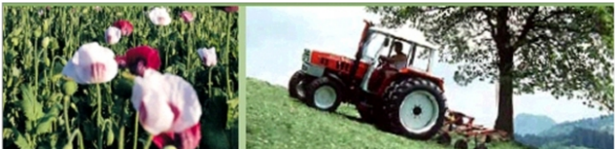
Grüner Bericht 2005