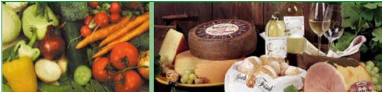
Grüner Bericht 2004