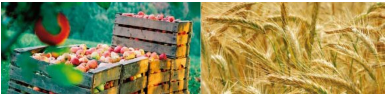
Grüner Bericht 2007